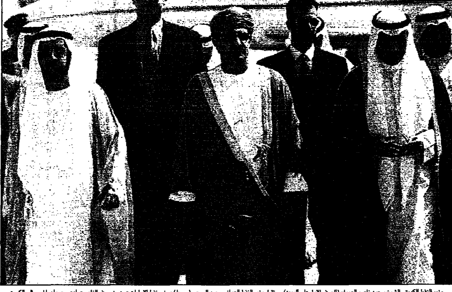
وزير النفط الكويتي الشيخ سعود ناصر الصباح (اليمين) يستقبل وزير النفط السعودي محمد الرمعي (وسط) ووزير نفط الامارات عبيد بن سيف الناصري لدى وصولهما امس الى الكويت

وارتفعت الاسعار ثلاثة دولارات تقريبا منذ منتصف اب (اغسطس) الا انها ما تزال اقل من متوسط سعر العام